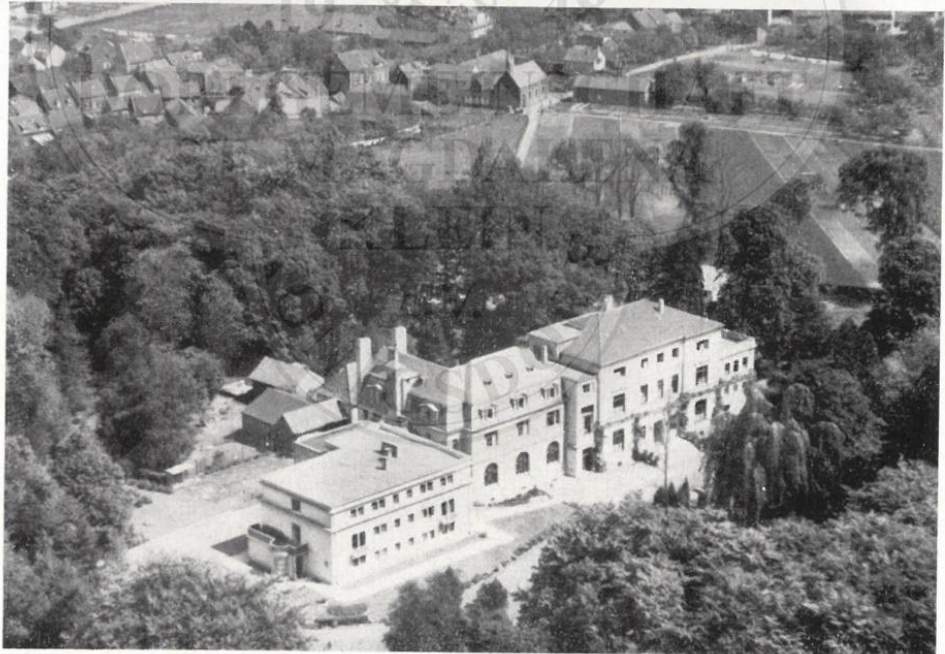
20 Elisabethenkloster (12)