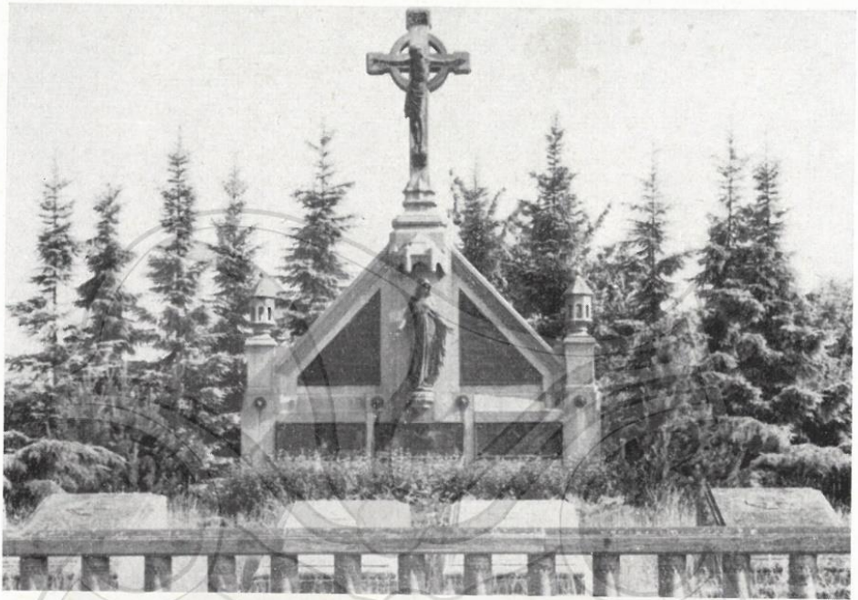
19 Paulische Begräbnisstätte (12)

Dorfgemeinschaft St. Magdalena 1948 Kleinkönigsdorf e.V.